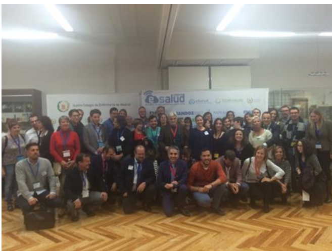
Foto de todos los panelistas de la Blogosfera sanitaria 2017